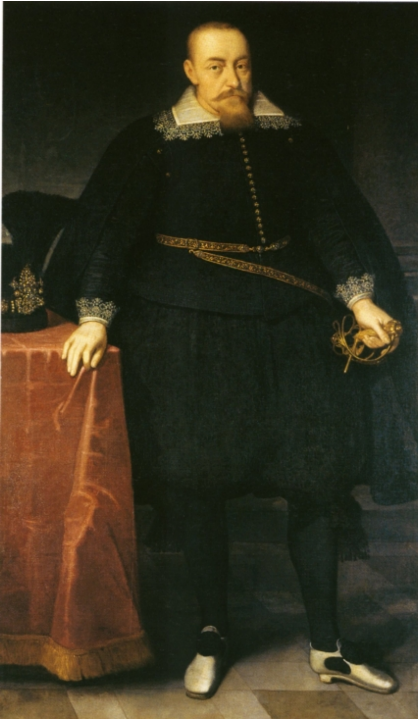
rys.2. Portret króla Zygmunta III, malarz austriacki, ok. 1625. Zamek Królewski w Warszawie.