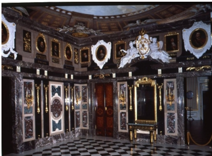
rys.4. Pokój Marmurowy. Rekonstrukcja stanu z 2. połowy XVIII wieku. Zdjęcie współczesne.