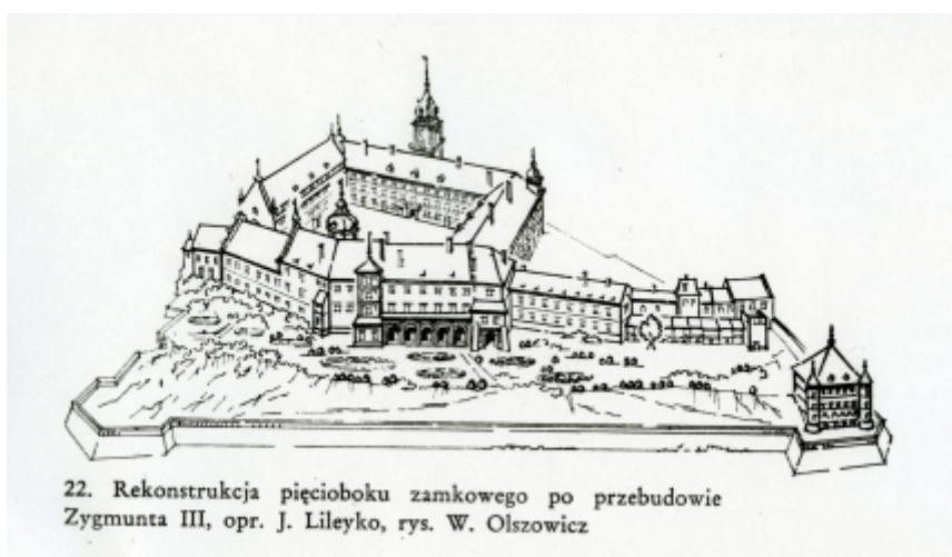
rys.1. Rekonstrukcja pięcioboku zamkowego po przebudowie Zygmunta III, oprac. J. Lileyko, rys. W. Olszowicz.