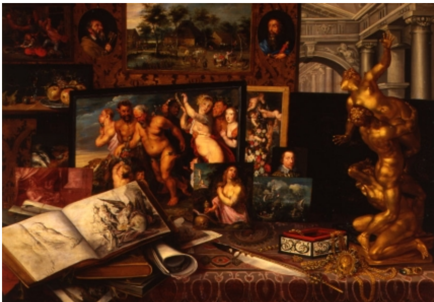
rys.6. Gabinet sztuki królewicza Władysława Zygmunta Wazy, malarz antwerpski, 1626. Zamek Królewski w Warszawie.