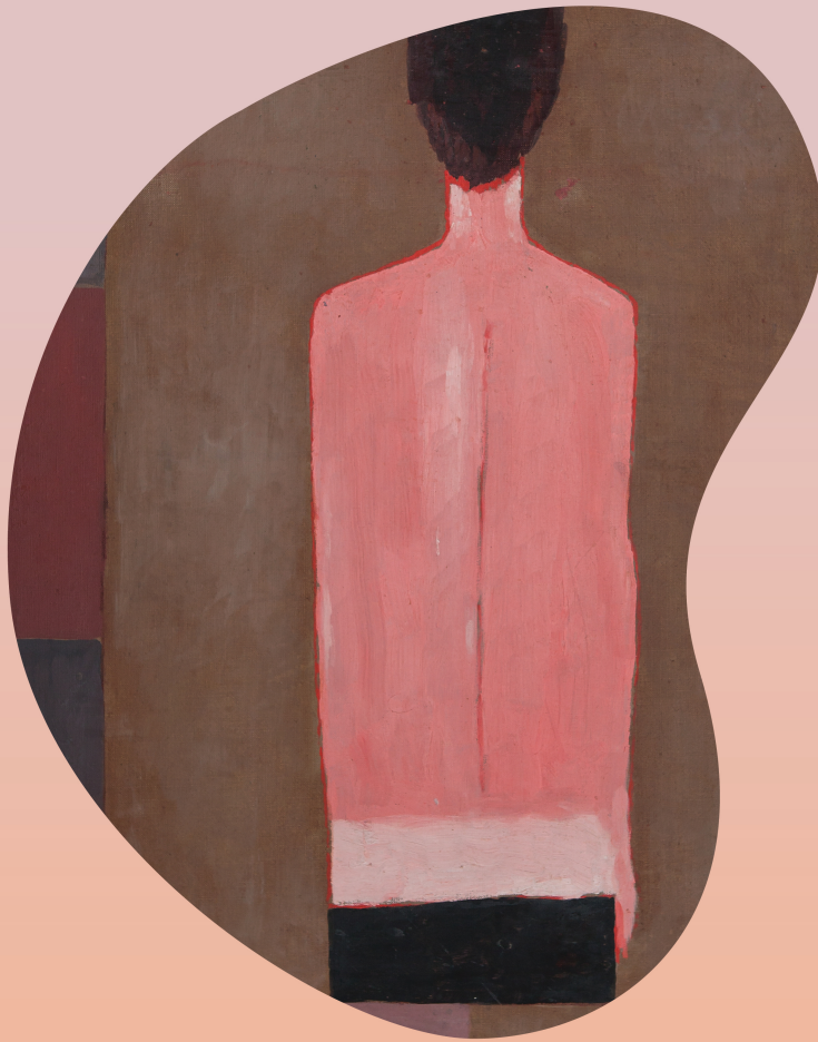
Opis wystawy 2