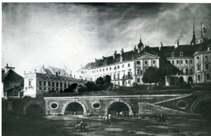
rys.3. Południowa część Arkad Kubickiego ze schodami - obraz Marcina Zaleskiego Zamek Królewski