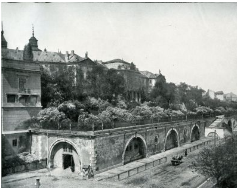
rys.4. Arkady Kubickiego – widok Zamku Królewskiego z wiaduktu Pancera, fotografia Konrada Brandla z 1899 r. Arkady zabudowane i przekształcone w stajnie wojskowe; widoczne poręcze do uwiązywania koni i budka wartownicza; wł. Muzeum Historyczne m.st. Warszawy

od strony Wisły z lat 1831-1835; Arkady jeszcze niezabudowane; wł. Muzeum Narodowe w Warszawie