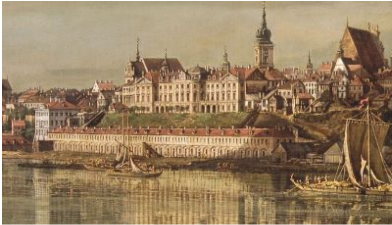
rys.1. Oficyna Tarasowa i Zamek Królewski – fragment Widoku Warszawy od strony Pragi Bernarda Bellotta zw. Canaletto z 1770 r.; wł. Zamek Królewski w Warszawie.