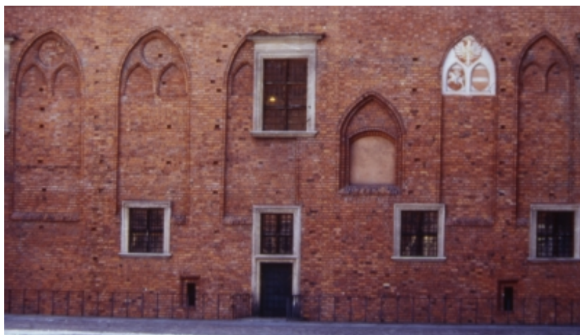
Dwór Wielki (elewacja zach.) odbudowany w latach 1972-1974, stan z 1995 r.

Pierwszym królem polskim goszczącym w Zamku Warszawskim był Władysław Jagiełło. W trakcie jednego z objazdów państwa, wiosną 1426 roku, król spływał Wisłą statkiem z Kazimierza do Płocka. Po drodze zatrzymał się w Warszawie i kilka dni spędził w nowej rezydencji księcia Janusza III Starszego – Dworze Wielkim. Był jego gościem – Mazowsze nie należało do Królestwa Polskiego; rządzone przez dynastię Piastów mazowieckich było jedynie lennem królów polskich.