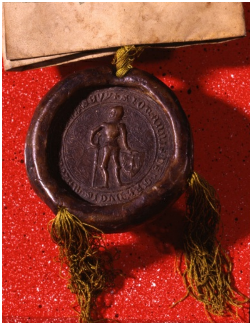
Pieczęć Janusza I Starszego, księcia wiskiego i warszawskiego przy dokumencie z 1379 r., wł.: Archiwum Główne Akt Dawnych, fot. M.Bronarski, Archiwum Zamku Królewskiego.

drewniano-ziemnym, odsłoniętym na skarpie południowej Zamku pisał już Tadeusz Żurowski, nadzorujący budowę trasy W-Z w 1949 r.