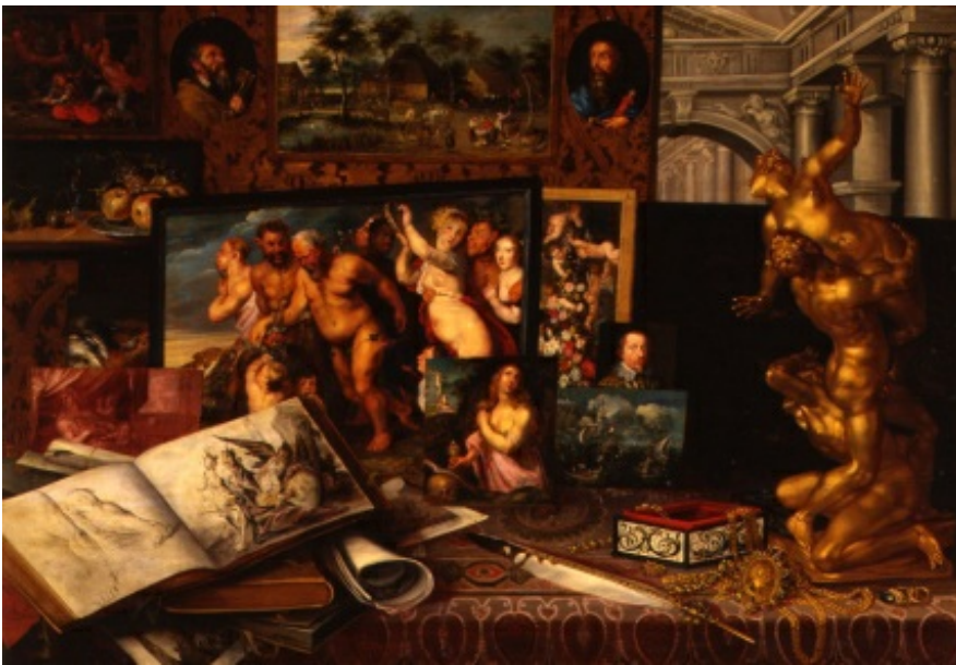
rys.6. Gabinet sztuki królewicza Władysława Zygmunta Wazy, malarz antwerpski, 1626. Zamek Królewski w Warszawie.