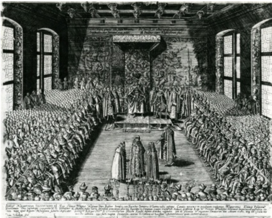
rys.6. Prezentacja królowi i stanom Rzeczypospolitej cara Wasyla Szujskiego i jego braci, w Sali Senatorskiej Zamku Królewskiego w Warszawie 29 października 1611 roku. Miedzioryt Tomasza Makowskiego wg obrazu Tomassa Dolabelli, po 1611.