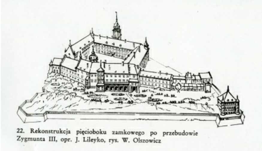
22. Rekonstrukcja pięcioboku zamkowego po przebudowie Zygmunta III, opr. J. Lileyko, rys. W. Olszowicz

rys.1. Rekonstrukcja pięcioboku zamkowego po przebudowie Zygmunta III, oprac. J. Lileyko, rys. W. Olszowicz.