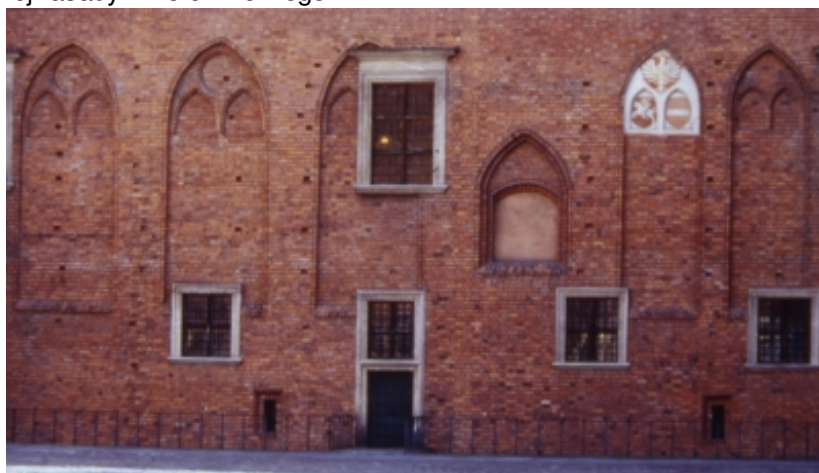
4. Dwór Wielki (elewacja zach.) odbudowany w latach 1972-1974, stan z 1995 r.