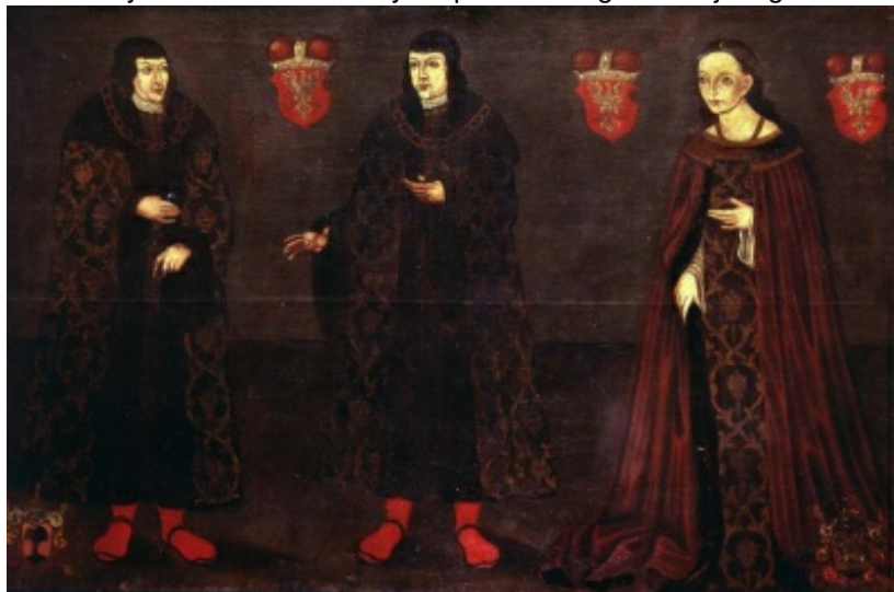
6. Portret Stanisława (w środku), Janusza III i Anny, książąt mazowieckich, ok. 1620-1640, wzorowany na pierwowzorze z 3. dekady XVI w., wł.: Muzeum Narodowe w Warszawie, depozyt w Zamku Królewskim

Po 1526 r. okazało się, że ostatni Piastowie mazowieccy żyli na kredyt, mimo że ojciec ich objął wyjątkowo bogaty skarbiec rodzinny. Tymczasem synowie Konrada III zrujnowali dobra książęce, spieniężyli klejnoty swojej siostry - Anny, nie płacili dworzanom, oficjalistom, rzemieślnikom i dostawcom. Dopiero przed samą śmiercią Janusz III w obecności najwyższych urzędników podyktował testament, wyznając swe winy wobec siostry. Pretensje wierzycieli, którzy zgłaszali się na Zamek warszawski po odbiór należności, uregulował ostatecznie dopiero Zygmunt Stary.