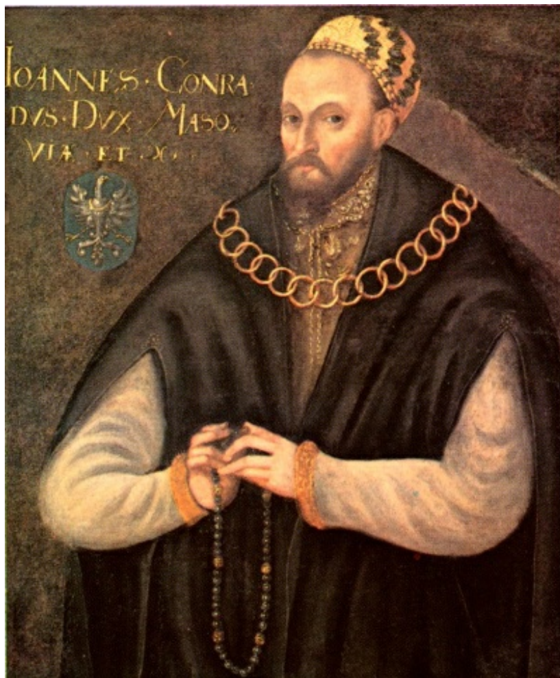
5. Portret Konrada III, ks. mazowieckiego, malarz polski, 3. ćw. XVI w., or.: Muzeum w Wilanowie; kopia XX w., Zamek Królewski w Warszawie

Był to kompleks budynków, położony na północ od Zamku obejmującego Dwór Wielki z Wieżą Grodzką, nazywany w języku łacińskim - Curia Minor , a po polsku - „Ogródek”. Przez badaczy jest określany jako Dwór Mały lub Mniejszy. Wzniesiony około połowy XV w., graniczył z domami kanoników kolegiaty św. Jana. Pierwsza pojawia się wzmianka w dokumencie z 1444 r. mówiąca o bliżej nieokreślonym „domu zamieszkania księżnej Anny”. Datowanie pozostałości architektonicznych najstarszego z domów Curii Minor na pierwszą połowę XV w. pozwala wiązać jego początki z obydwoma księżnymi tego imienia. Zamieszkiwały w nim zresztą nie tylko księżne. Dokument z 1475 r., wystawiony „we dworze i w domu książęcym, obok domu kanoników, w komnacie (sypialni) księcia Janusza [II]”, pozwala stwierdzić, że chodzi niewątpliwie o Dwór Mały. W 1499 r. Konrad III podarował go swej żonie Annie z Radziwiłłów, która także zmarła w roku 1522. Następnie stał się siedzibą ich córki, ostatniej księżnej mazowieckiej - Anny. Uszanował to król Zygmunt I Stary po inkorporacji Mazowsza w 1526 r., pozostawiając jej w użytkowanie ów dom Dworu Małego aż do zamążpójścia. Obydwa Dwory były zdobione wewnątrz polichromią. Szczątki malowideł ściennych istniały jeszcze do czasu zburzenia Zamku.