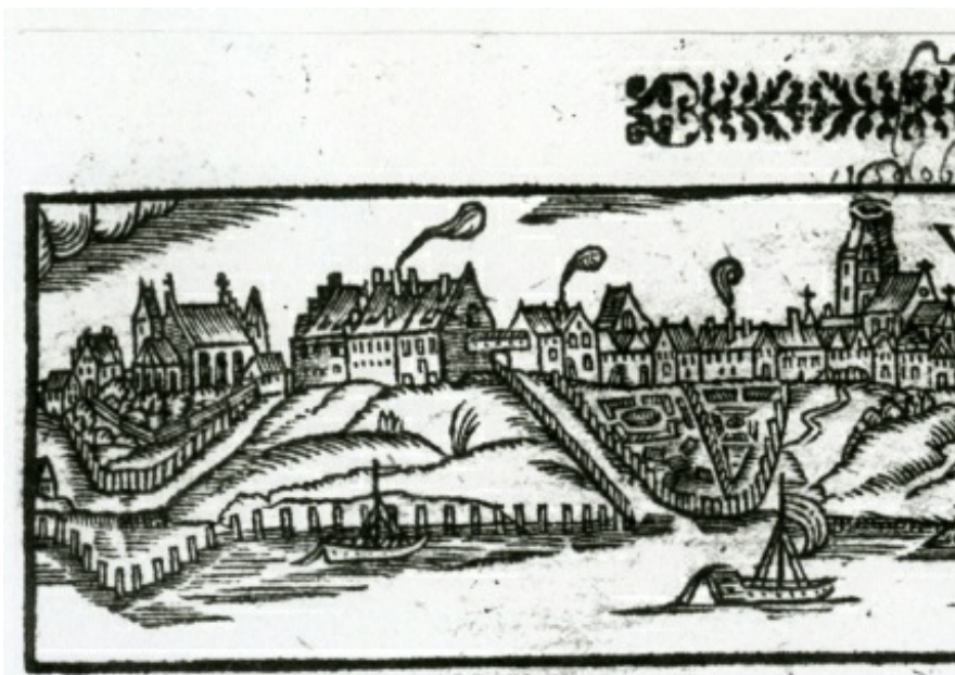
rys.2. Zamek Królewski po przebudowie z lat 1563-1571. Fragment widoku Warszawy z 1581 roku. Budynki widoczne od lewej: kościół i klasztor bernardynów św. Anny, Budynki Dworu Wielkiego (Wież Grodzka i Dom Wielki), Nowy Dom Królewski z gankiem; budynki pomocnicze stojące przy murze wschodnim: kuchnia, dom dworek (fracymery Anny Jagiellonki), łaźnia; budynki Dworu Mniejszego z kaplicą, kolegiata św. Jana, dom kustosza i domy kanoników („kanonie”). Nad Wisłą przeciwpowodziowe umocnienia skarpy zamkowej.