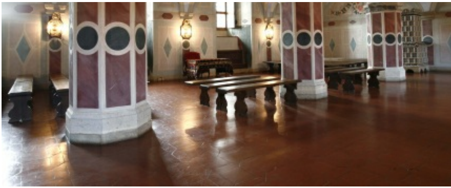
rys.5. Izba poselska w przyziemiu dawnego Dworu Wielkiego. Zdjęcie współczesne.

Zamek Królewski w Warszawie - Muzeum. Rezydencja Królów i Rzeczypospolitej www.zamek-krolewski.pl