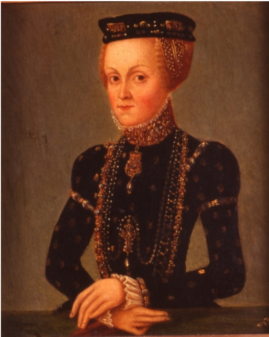
rys.4. Portret królowej Anny Jagiellonki z zespołu miniatur Rodziny Jagiellońskiej. Kopia XIX w. oryginału z warsztatu Lucasa Cranacha Młodszego, 1553-1556.