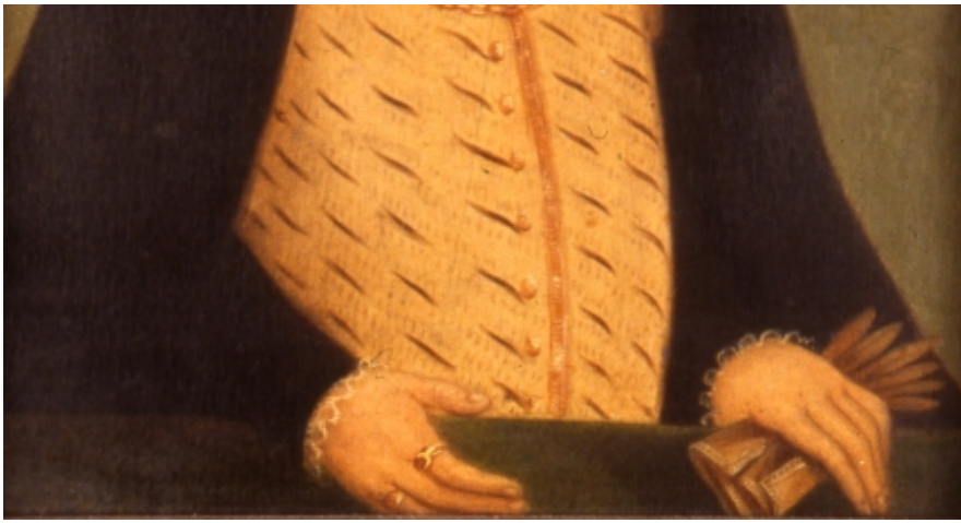
rys.3. Portret króla Zygmunta Augusta z zespołu miniatur Rodziny Jagiellońskiej. Kopia XIX w. oryginału z warsztatu Lucasa Cranacha Młodszego, 1553-1556.