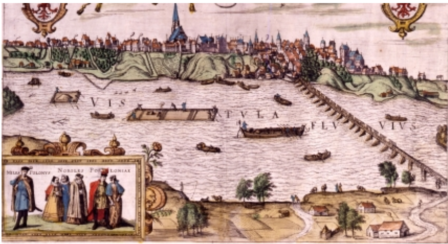
rys.1. Widok Warszawy z mostem przez Wisłę, po 1586. Rycina z dzieła G. Brauna, F. Hogenberga, Civitates orbis terrarum..., Kolonia 1618