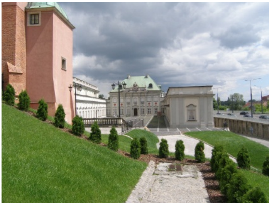
Pałac Pod Blachą