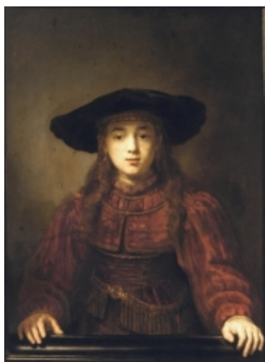
Dziewczyna w ramie obrazu