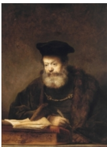
Uczony przy pulpicie