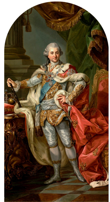
M. Bacciarelli, Stanisław August w stroju koronacyjnym, 1771 r.